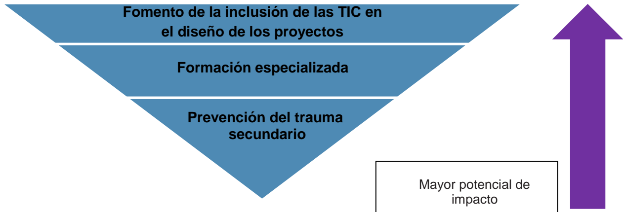
Gráfico 4. Niveles estratégicos de la implantación del enfoque de la AIT en España