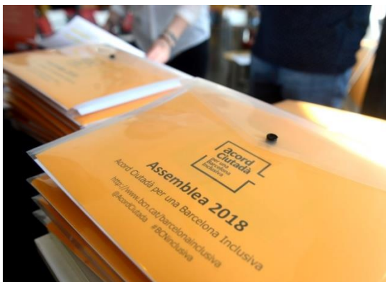
Valoració de l'Assemblea 2018