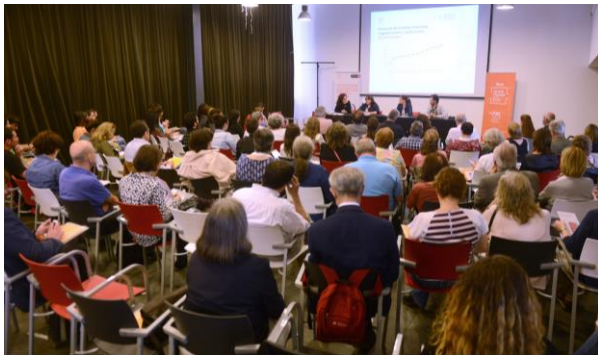
Noelia Palacios. Referent de la Xarxa NUST.

8. La Xarxa d'acollida i acompanyament per a persones immigrades va realitzar durant el 2017: